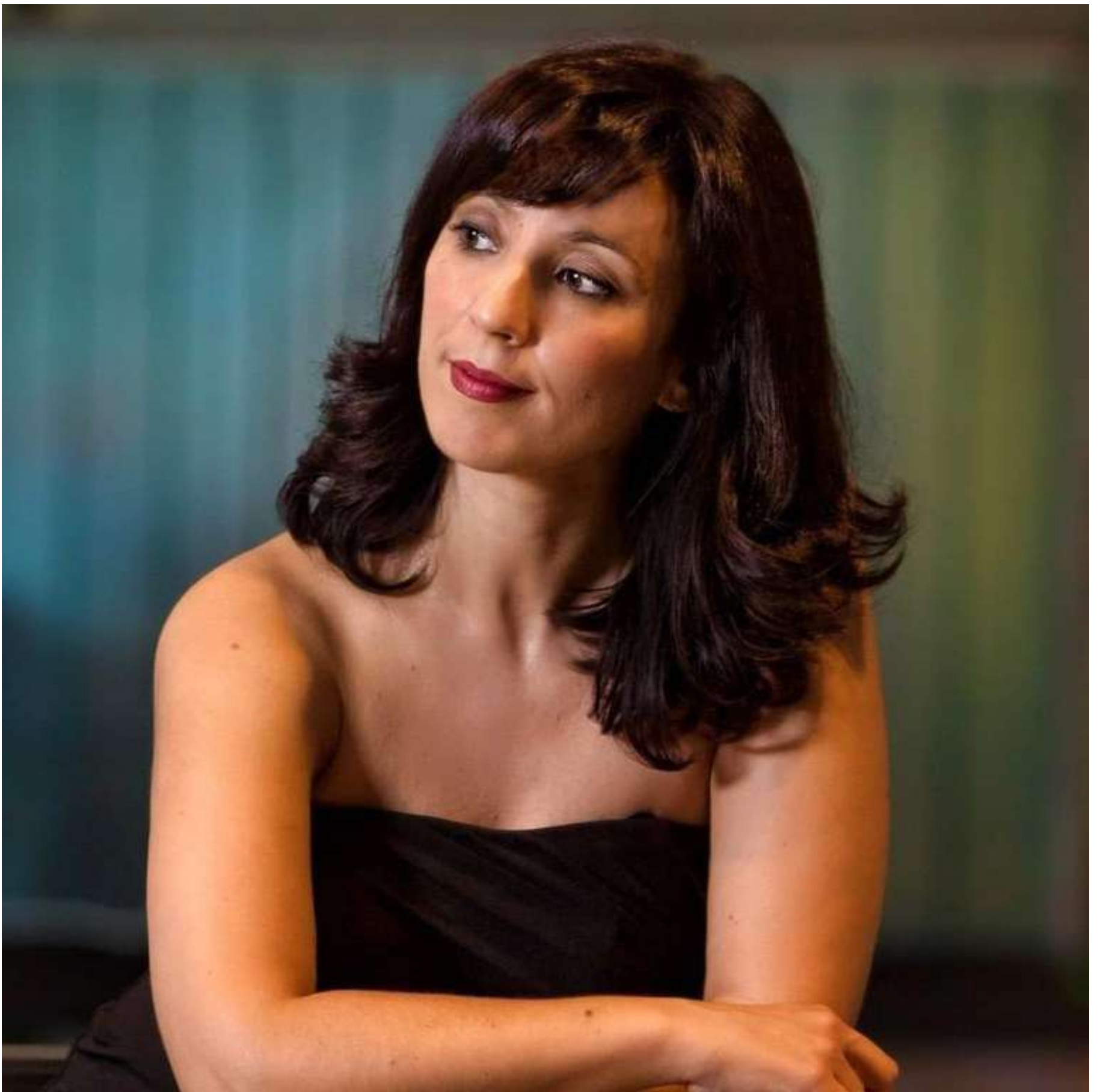
Cristina Bayón, soprano

la excitación y vehemencia darán paso al sosiego afectivo y la apacible búsqueda del amor.